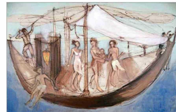
"Felicidad sin puerto". Su atmósfera poética y mítica vuelve a los primitivos.

"Creo que Ulises tenía razón con el 'Canto de la sirena'. Para un hombre sensible en el arte, la belleza y la mujer tienen algo que ver. Esta pintura es más dantesca