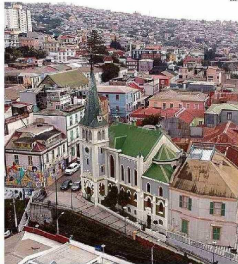
LA OBRA RELEVA LA PARTICIPACIÓN DE MUJERES EN LAS INSTITUCIONES.

Urzúa, simulando un ejemplo para entender de manera práctica en qué consiste su obra, indica que “son como especies de partituras que si las sabemos leer e interpretar, nos pueden ayudar a aclarar el presente medio confuso que tenemos ahora. Esto no es sólo para filósofos y especialistas, está escrito originalmente por pluma de mujeres modestas de Valparaíso y de Bomberos de la ciudad; entonces, es un patrimonio que tiene que ver con la sociedad