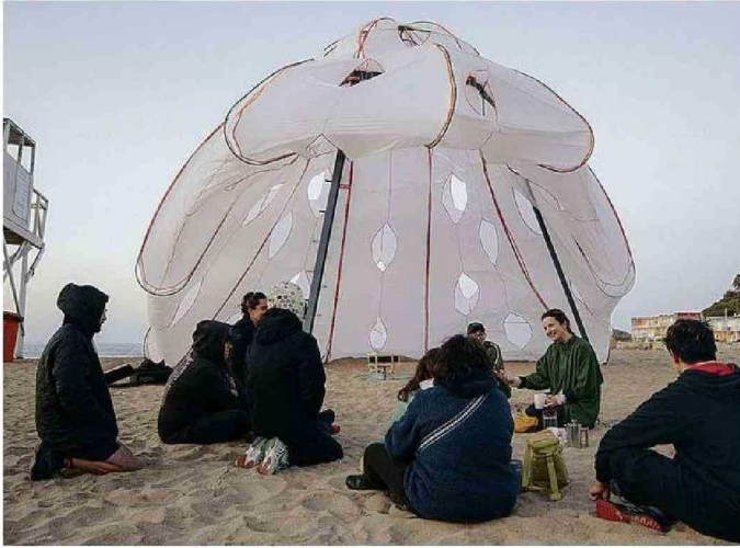
LA CARPA FUE DISEÑADA CON MATERIALES RECICLADOS.