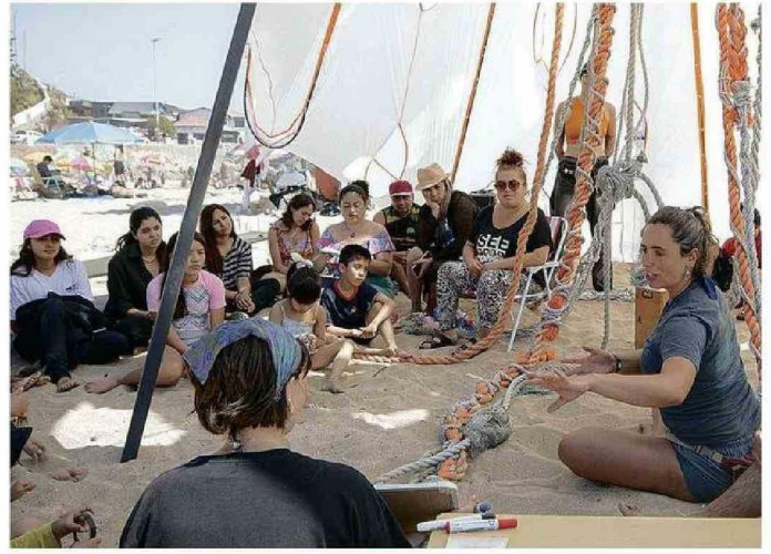
OFRECERON CREACIONES INSPIRADAS EN LAS MEDUSAS Y TALLERES PARA TODO PÚBLICO.