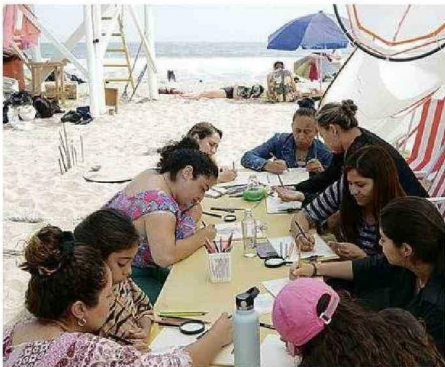
TALLERES CONECTARON ARTE, CIENCIA Y LA COMUNIDAD COSTERA.