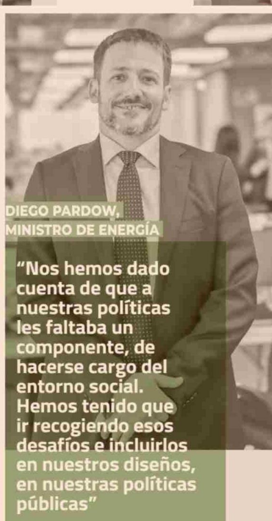
DIEGO PARDOW, MINISTRO DE ENERGÍA

"El desafío hoy, junto con esta mejora de productividad, tiene que ver con cómo minimizamos, reducimos, nuestros impactos y generamos legitimidad socioambiental. En minería eso es lo clave"