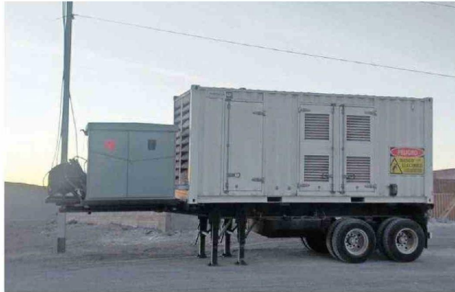
AYER POR LA MAÑANA SE LOGRÓ INSTALAR EL GENERADOR ELÉCTRICO A LA ESPERA DE LA REPOSICIÓN TOTAL.

Ayer y desde temprano equipos técnicos efectuaron trabajos para entregar energía de forma parcial, desde las 7 de la mañana y hasta la medianoche en el poblado y en el valle de Lasana. "Nuestra municipalidad al tomar conocimiento del robo de cables y los daños a la postación, ofició a la Delegación Presidencial para atender al corte de suministro eléctrico, y se hicieron gestiones con la empresa a cargo del suministro, para la instalación de un generador en las comunidades afectadas, y también las gestiones para subsanar el problema. Y siendo las 11.36 de la mañana, CGE informó que están los generadores con el respaldo suficiente para los vecinos de Chiu Chiu y Lasana. Además, el municipio está coordinando la acción de poder reprogramar el trabajo de los camiones aljibes para poder proveer la entrega de agua po-