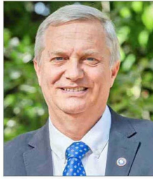
José Antonio Kast , candidato del Partido Republicano.