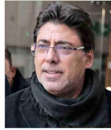
Daniel Jadue (PC) , ex candidato presidencial.

ter — que ha manifestado su interés de competir en las primarias de Chile Vamos— y el diputado Johannes Kaiser, quien está en plena recolección de firmas para constituir un partido que sustente su campaña.