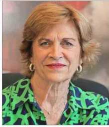
Evelyn Matthei (UDI) , exalcaldesa de Providencia.

El sondeo reveló, además, que el 49% de las personas que respondieron asegura que no les interesan las primarias voluntarias para elegir candidatos de algún sector político que compitan en las presidenciales.