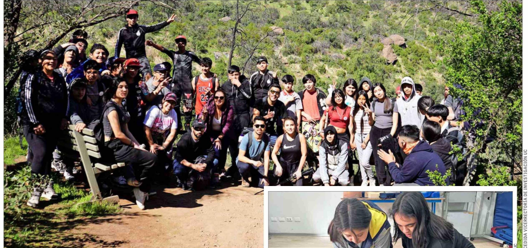
En una visita a la Quebrada de Macul, estudiantes del Centro Educativo Eduardo de la Barra de Peñalolén aprendieron a identificar riesgos naturales.

“¡Vamos, continúen! Dos, tres, cuatro... ¿Cuándo debo detener las