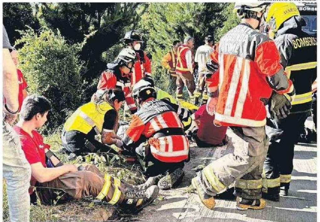
LOS TRABAJADORES FUERON ATENDIDOS POR VOLUNTARIOS DEL CUERPO DE BOMBEROS TOMECINO.

“Once personas resultaron lesionadas, diez brigadistas más el conductor, quienes, en estos momentos están siendo atendidos por el equipo de