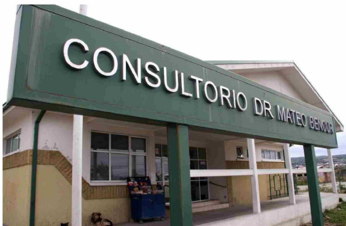
EL CESFAM MATEO BENCUR DE PUNTA ARENAS ATIENDE ALREDEDOR DE 30 MIL USUARIOS.

H ace unos días quedó al descubierto una serie de problemas que están teniendo los funcionarios del Cefsam Mateo Bencur de Punta Arenas. Esto da cuenta de las “precarias condiciones laborales” con la que se encuentran trabajando en la Atención Primaria de Salud.