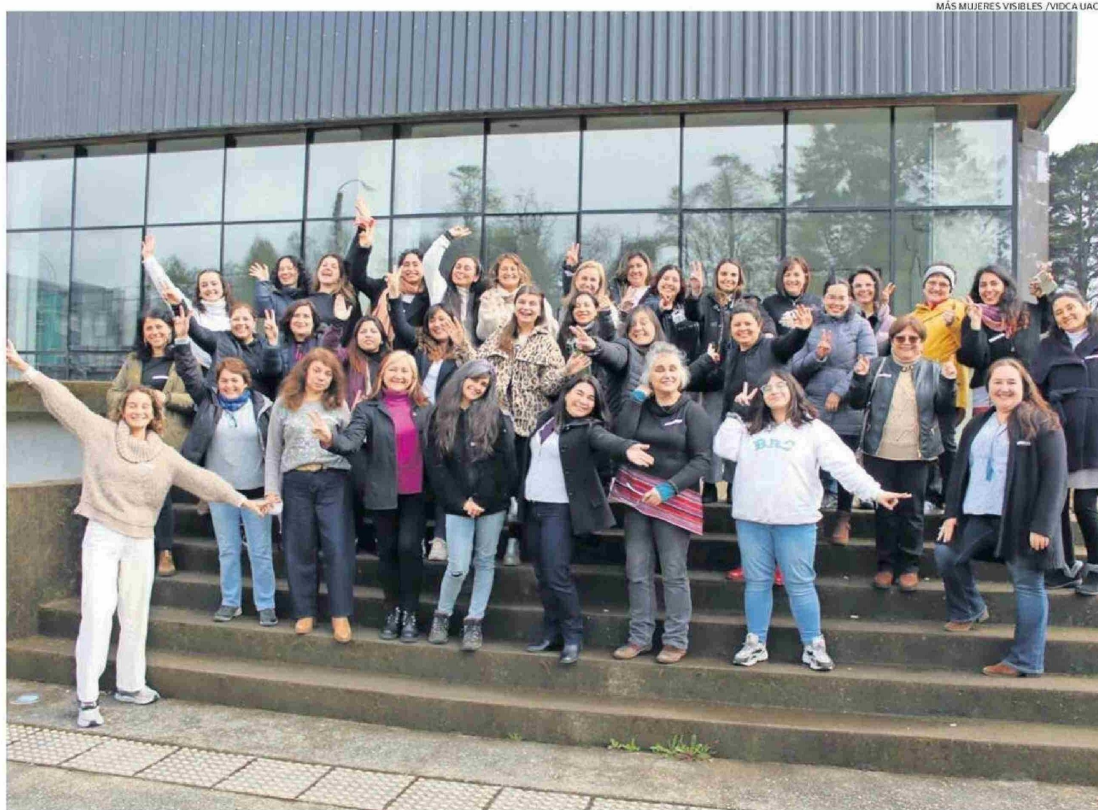
MÁS MUJERES VISIBLES /VIDCA UACH

Emprendedoras y empresarias de las doce comunas participan en un programa que apunta a la igualdad de género. Desde el año pasado la instancia se ha vuelto un lugar de encuentro para los negocios, el desarrollo de ideas y también para el bienestar físico y emocional.