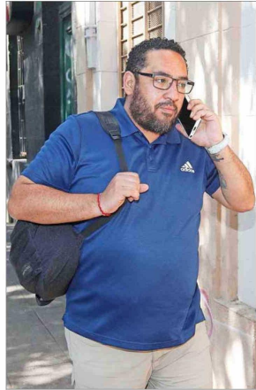
Nicolás Cataldo, actual ministro de Educación y militante PC, al entrar al ICAL.