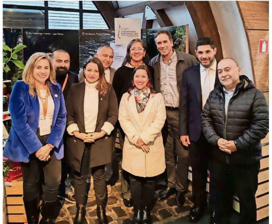
AUTORIDADES REGIONALES Y COMUNALES PARTICIPARON EN EL ENCUENTRO NACIONAL DE GOBERNANZAS QUE FUE LIDERADO POR LA SUBSECRETARIA.

Precisó que se trata de la ruta Ríos, Lagos y Volcanes. "Son parte del corazón de la oferta cuando hacemos promoción internacional. Y sabemos que también es muy relevante para la región la promoción que se haga con Argentina, y también