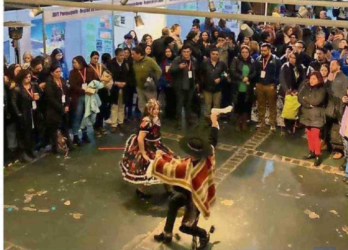
EL ENCUENTRO DE GOBERNANZA EN TURISMO COMENZÓ AYER CON UNA CEREMONIA EN LA CARPA DEL CECS.

a fin de hacer algunas propuestas durante el ingreso de las indicaciones.