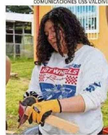
COMUNICACIONES USS VALDIVIA.