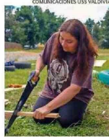
COMUNICACIONES USS VALDIVIA.

EN SU PRIMERA VERSIÓN, LA CONVOCATORIA DE ACCIÓN FUE SEGUIDA POR TREINTA Y CUATRO JÓVENES DE DISTINTAS CARRERAS DE LA CASA DE ESTUDIOS.