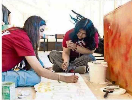
TRABAJOS INCLUYERON PINTADO DE JUEGOS Y ÁREAS DE ESPARCIMIENTO.