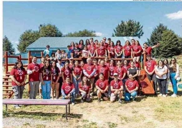
COMUNICACIONES USS VALDIVIA.

tancia que ha sido una oportunidad de crecimiento para ellos, de enriquecimiento en el sentido de tener una relación con esta comuna, en una zona