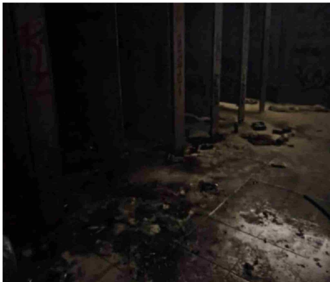
► Imágenes de los baños al interior del Internado Nacional Barros Arana después del siniestro causado por el estallido de las bombas molotov.