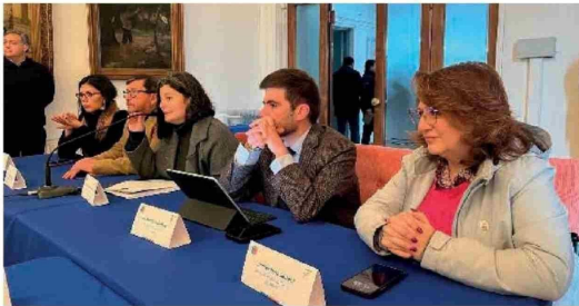
LA REUNIÓN se realizó poco antes del mediodía de este viernes.

tanto en la Araucanía como en Biobío. En el Biobío tenemos una baja de un 5.8% en los delitos comunes, y eso también es algo extremadamente positivo en el trabajo que se está haciendo".