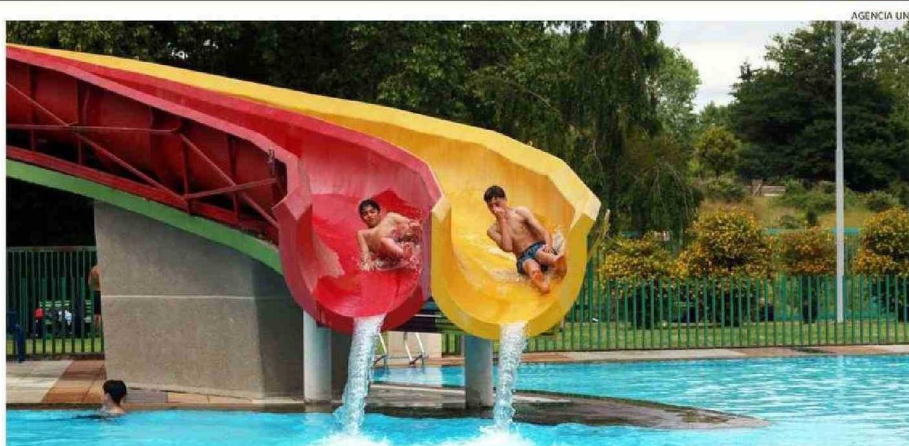
PESE A QUE EL DÍA ESTUVO ALGO NUBLADO, IGUAL LLEGARON BAÑISTAS A DISFRUTAR DE LAS PISCINAS DEL PARQUE CHUYUCA Y DE SUS ATRACTIVOS.

las piscinas, de todas las áreas verdes y también de canchas de fútbol, básquetbol y de tenis, que también tenemos en el lugar", detalló.