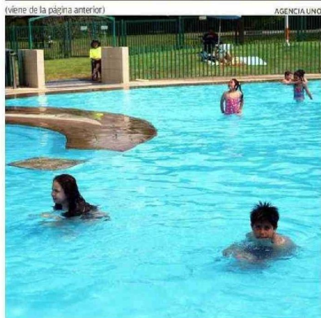
LAS PISCINAS DE CHUYUCA CONTEMPLAN ESPACIO PARA LOS MÁS PEQUEÑOS.

bañistas en la zona, que son alrededor de mil.