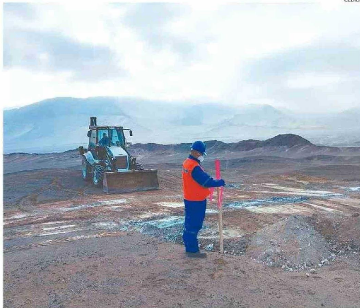
EL INFORME PERICIAL PRESENTADO EN EL JUICIO DESTACÓ LAS OBRAS DE EXPLORACIÓN MINERA EN CALETA BOLFIN.