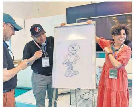
La idea de Stern es poder presentar el libro en Concepción.

"Fue interesante hacer el cruce sobre cómo eran tratados los mismos temas en los diarios de cobertura nacional, más bien de Santiago, y El Sur -por ejemplo- fue una motivación adicional para reivindicar la historia local de Concep-