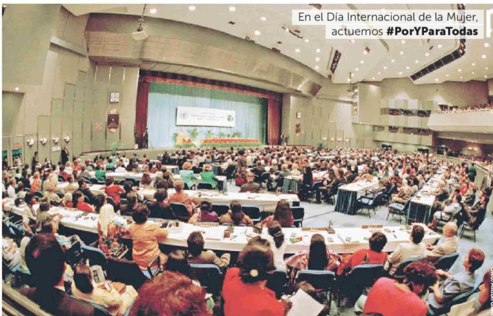
En el Día Internacional de la Mujer, actuemos #PorYParaTodas

También destacan los avances en políticas públicas para promover la igualdad de género y proteger los derechos de las mujeres y las niñas, tales como la reciente aprobación de la Ley de Violencia Integral y la Ley Karin. Asimismo, el Sistema Integral de Cuidados supone un paso para alcanzar la corresponsabilidad y dar oportunidades de desarrollo profesional y personal a miles de mujeres en el país. Estos hitos, y tantos otros que hemos presenciado en materia de políticas públicas, han sido apoyados en su desarrollo de manera colaborativa por distintas agencias del