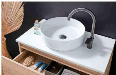
Mosaico ha diseñado diferentes productos para optimizar la gestión del agua.

Más información sobre productos y tecnologías en www.mosaico.cl