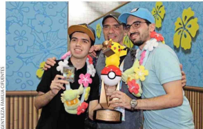
"Yo soy como el coach de esta cuestión, el entrenador, el psicólogo, el economista, todo. Veo muchos videos de cómo juegan los japoneses, investigo y veo a los que juegan", cuenta Marco padre, el del medio en la foto.

—Había gente de no muy buenos hábitos. Por ejemplo, algunos