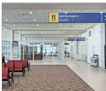
El terminal tendrá más puertas de embarques habilitadas, con un área internacional permanente.

tividad de personas que vuela hacia el norte de Chile, como Antofagasta, Calama, Iquique, que merece una atención especial por nuestra parte, porque son muchas las personas y trabajadores en particular que los usan".