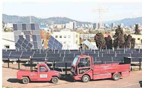
Programas como el Diplomado en Educación Ambiental, Certificación y Sustentabilidad, y Diplomado en Electromovilidad son solo algunos de los 72 ofertados por la casa de estudios superiores.

La innovación, sostenibilidad y energía, son áreas importantes que se abordan en los programas actualmente vigentes.