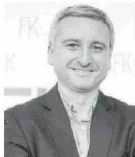
Por Jorge Fantuzzi Economista