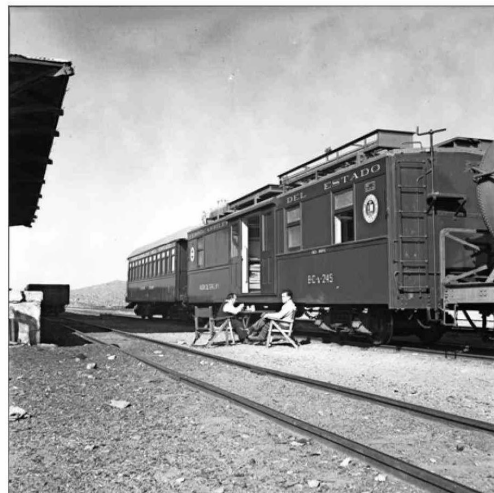
Fotografía hecha por Roberto Montandón en el exterior del "Vagón cultural" (1941), iniciativa de la U. de Chile.

regiones, con el propósito de conocer la diversidad del mundo ferroviario, y también pesquisas en archivos e instituciones como la Biblioteca Nacional y museos como el Histórico Nacional, el Nacional de Bellas Artes, el Ferroviario de Temuco, o el Hualpén de Concepción. Igualmente, los curadores consultaron colecciones privadas.