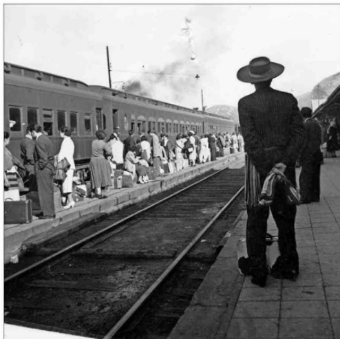
Marcos Chamudes tomó esta imagen hacia 1950 en una estación de la zona central. Estará en "Por la línea corre el tren".

"Por la línea corre el tren" fue antecedida por una investigación iniciada en 2023. Contempló viajes por