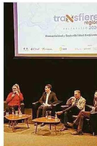
HUBO DIVERSAS EXPOSICIONES.