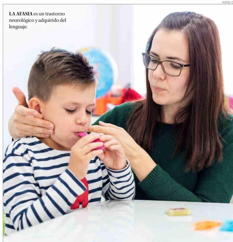
LA AFASIA es un trastorno neurológico y adquirido del lenguaje.

La expresión verbal y/o la comprensión se alteran en este trastorno del lenguaje que se origina en lesiones cerebrales e interfiere en el normal desenvolvimiento y relaciones sociales y afecta gravemente la salud mental y calidad de vida.