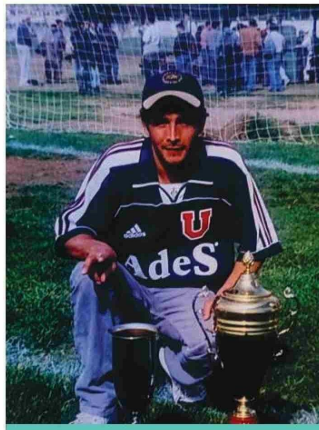
Junto a trofeos que obtuvo en sus momentos de gloria.