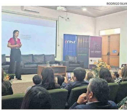
TRES PRESENTACIONES SOBRE LAS MUJERES EN LA ÚLTIMA JORNADA.