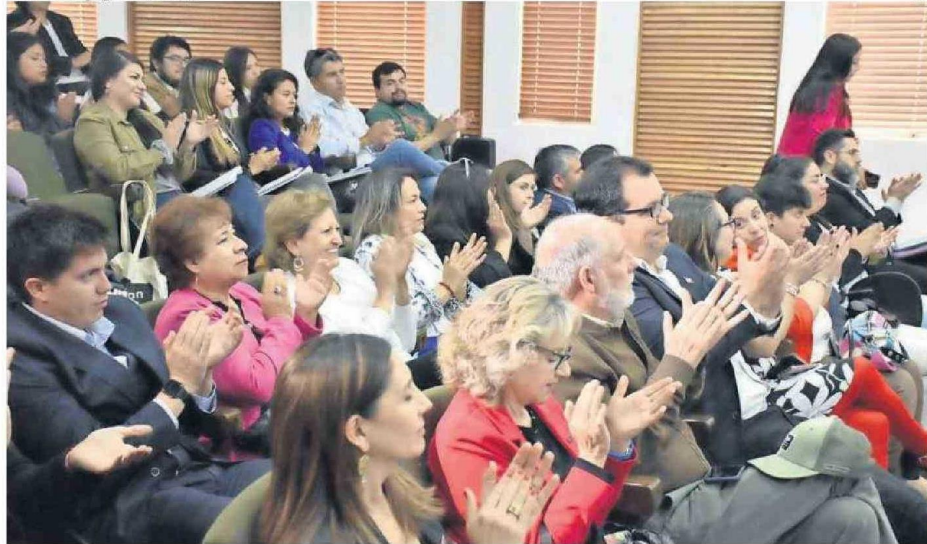
GRAN CANTIDAD DE ASISTENTES EN LOS TRES DÍAS DE SEMINARIOS EN EL XI SEMANA DE LA CONSTRUCCIÓN.

Otro detalle relevante explicado por Lufty tiene relación a que las cifras del INE difieren a la de la MUCC, puesto que desde sus estudios se demuestra que 54 mil mujeres están en el rubro de la construcción en Chile, equivalente sólo al 8,4% de participación, no el 17%.