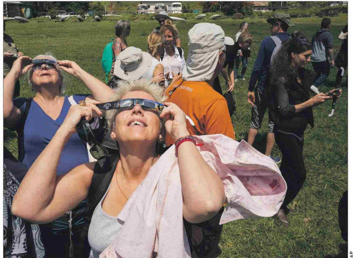
En Isla de Pascua el eclipse comenzó a las 14:07 horas, con una duración de aproximadamente 5 minutos y una cobertura del 93%. En Cochrane, el eclipse fue catalogado como total.

La Luna pasó frente al Sol, pero no lo cubrió por completo, lo que dejó visible un brillante borde de luz alrededor de ella.