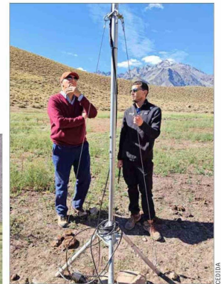
Para el monitoreo de aguas subterráneas se instalaron antenas de transmisión satelital como esta.