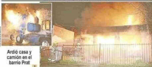
Ardió casa y camión en el barrio Prat