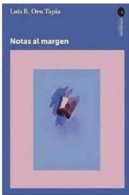
EL LIBRO "NOTAS AL MARGEN" REFLEXIONA SOBRE EL MOMENTO POLÍTICO Y SOCIAL ACTUAL Y SOBRE EL ROL DE LA GENERACIÓN DE LOS 80.