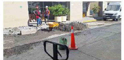
La rotura en la matriz de agua potable fría fue en la calle J, lo que desató una emergencia que obligó a suspender los labores regulares del recinto hospitalario.