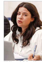
“Si bien pudo haber sido más rápida (...), lo cierto es que la romancía del exsubsecretario se hizo efectiva”, señala la titular de la Mujer.

LA INQUIETUD POR LA REBAJA EN LAS PARTIDAS DEL ÓRGANO PERSECUTOR | C 2