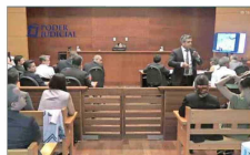
El grupo es indagado por estafa, soborno y figuras penales de la Ley de Mercado de Valores, entre otros.

Cuatro alumnos del INBA siguen hospitalizados, a casi tres meses de la explosión por elaboración de molotovs | C 7