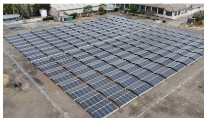
La planta solar La Fábrica, en Estación Central, es operada por Gasco Luz, como parte de las iniciativas con que Santander realiza su gestión de una forma más responsable con el medio ambiente.