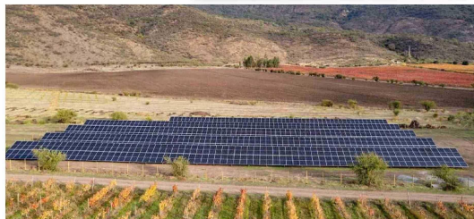
Santander cuenta actualmente con cinco plantas solares en operación, entre ellas, la de Placilla, ubicada en la Región de O'Higgins, operada por Big Sur Energy.

El proceso de evaluación de las empresas nominadas en ALAS20, llevado a cabo por MorningStar Sustainability, se realiza en base a información pública disponible.