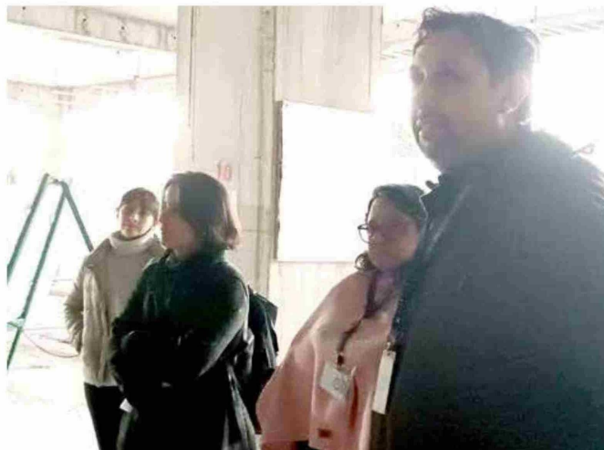
Colegio Médico, visitando la construcción del nuevo Hospital de Linares.