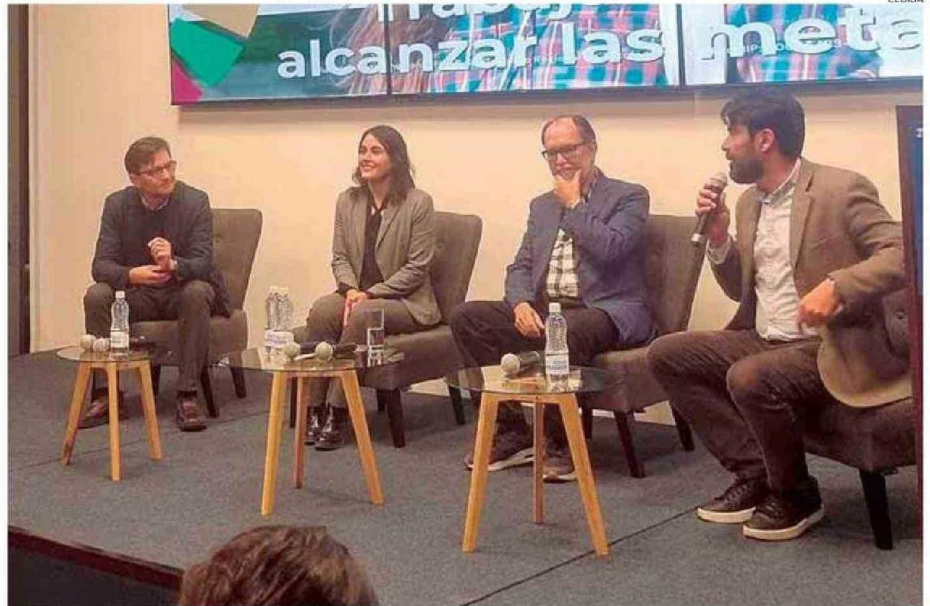
EL INFORME FUE PRESENTADO EN EL AUDITORIO DEL MERCURIO DE ANTOFAGASTA.

Sin embargo, el académico alerta sobre los puntos críticos para la región, puntualizando