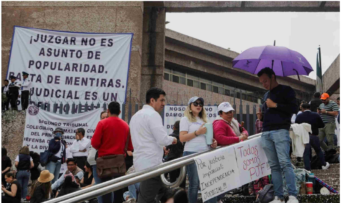
► Manifestantes en el edificio del Consejo de la Judicatura Federal mientras trabajadores del Poder Judicial de México inician huelga indefinida nacional, en Ciudad de México