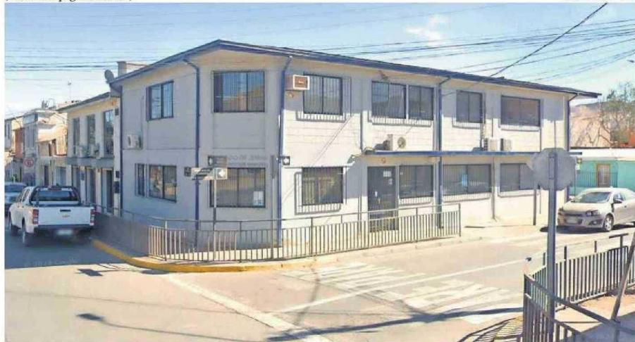
EL JUZGADO DE LETRAS DE DIEGO DE ALMAGRO ES SINDICADO POR LOS PROFESORES COMO UN TRIBUNAL CON UNA ANORMAL DEMORA EN LOS JUICIOS.