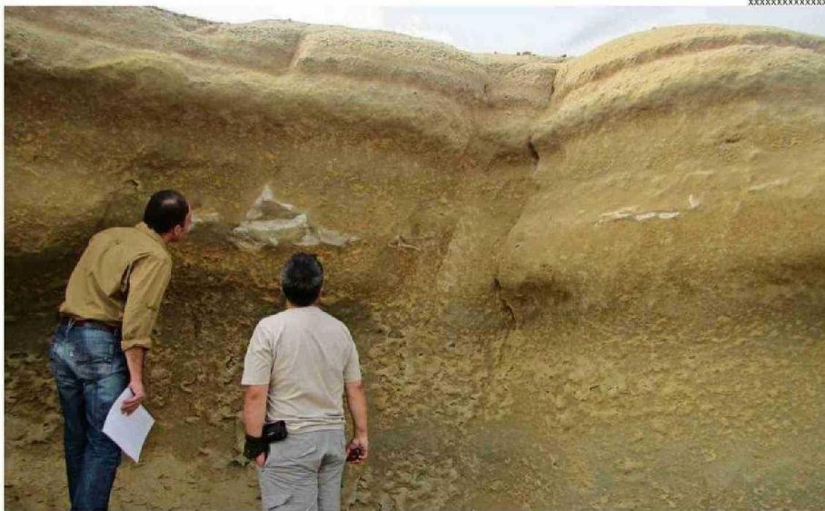
Bahía Inglesa es uno de los sitios fosilíferos más importantes del país.

Probablemente, no hay historia más significativa para toda la humanidad y para todos nosotros que la historia de cómo nos transformamos en lo que somos. Y no hablo sólo de la humanidad, hablo de todos los seres vivos: de cómo una planta llegó a ser esa planta, de cómo un insecto llegó a ser ese insecto. En ese sentido, esta historia de la vida, que es historia propiamente tal, porque tiene pruebas, hace que