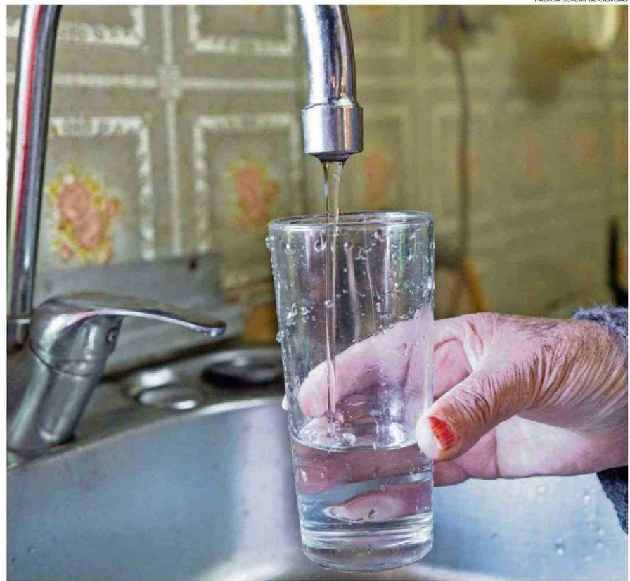
ACTUALMENTE EL AGUA QUE SE GENERA A PARTIR DE LOS APR DEBE SER DESINFECTADA CON CLORO. ALTERNATIVA USARÍA ÁCIDO HIPOCLOROSO.