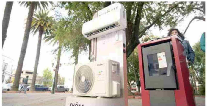
Los postulantes pueden revisar las Actas de Seleccionados para saber si fueron seleccionados.