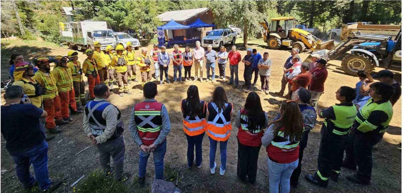
CON ESTA ACCIÓN SE BUSCA RESGUARDAR EL APR MÁS GRANDE QUE HAY EN EL SECTOR RURAL DE LA ZONA.