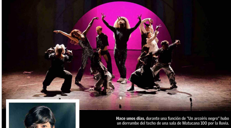
Hace unos días, durante una función de “Un arcoiris negro” hubo un derrumbe del techo de una sala de Matucana 100 por la lluvia.

Disminuir la sensación de riesgo de los espectadores al ir a ver una obra y mejorar problemas de infraestructura son parte de las prioridades del gremio y motivan una serie de medidas.