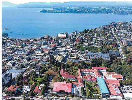
Patagonia Biotech Hub es un espacio de innovación y colaboración dedicado a la biotecnología, ubicado en Puerto Varas. Su misión es catalizar el desarrollo de soluciones biotecnológicas que impulsen el progreso económico y social en Chile y la región.

sado de una economía enfocada en industrias tradicionales —minería, agricultura, salmonicultura— a un escenario donde el emprendimiento y la innovación son cada vez más protagonistas, impulsados por iniciativas como Startup Chile.