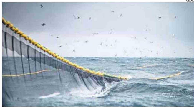
ESTOS EPISODIOS DE CALENTAMIENTO OCEÁNICO PODRÍAN INCIDIR DIRECTAMENTE EN EL DESPLAZAMIENTO DE PECES Y EN EL NÚMERO Y CRECIMIENTO DE MOLUSCOS.

lisis de datos históricos entre 1948 y 2023, encontrando que estos eventos costeros, incluyendo la contraparte fría llamadas “Niñas Costeras”, ocu-