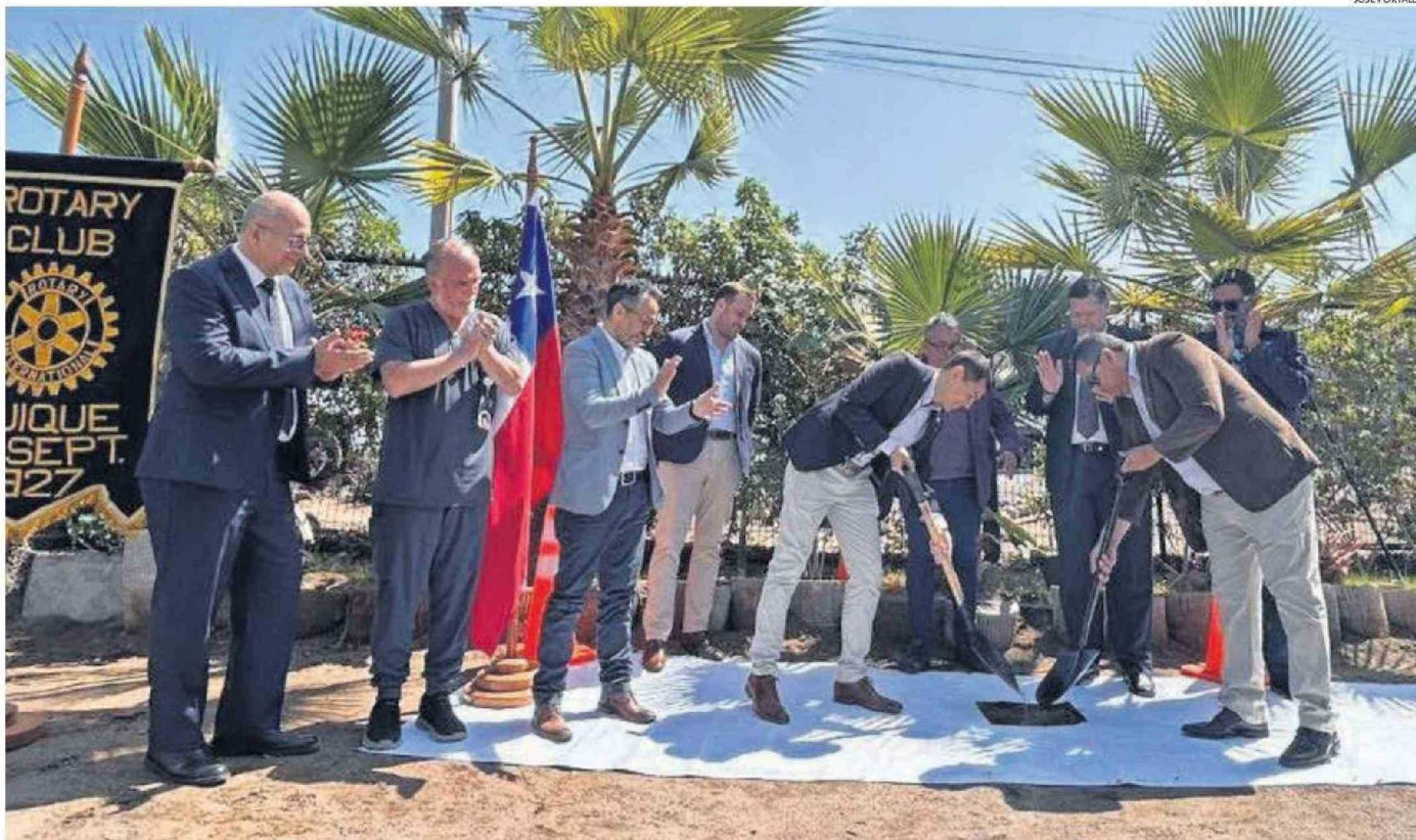
LA CEREMONIA DE LA PRIMERA PIEDRA SIMBÓLICA SE REALIZÓ EN LAS DEPENDENCIAS DEL CENTRO DE DIÁLISIS DE LA CORPORACIÓN PAUL HARRIS.