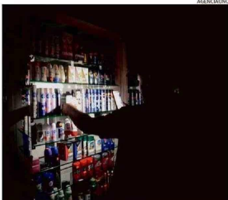
LA EMERGENCIA NO QUEDÓ RESUELTA ANOCHÉ.

fuerte tormenta con vientos de gran intensidad y lluvias torrenciales dejó sin electricidad a la capital, generó un caos similar y enervó a la población, que en ciertos sectores estuvo casi un mes sin suministro.