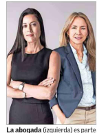
La abogada (izquierda) es parte de cuatro mesas y la vicepresidente de la CPC, de tres.